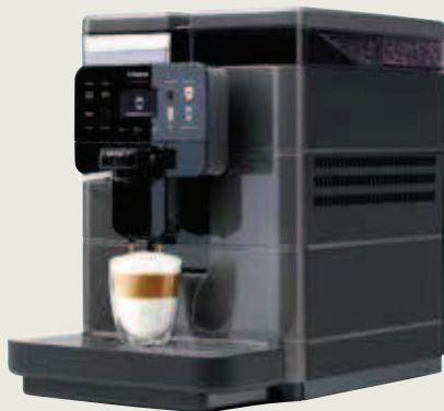
Royal One Touch Cappuccino