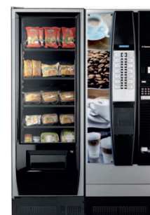
Corallo 1700 + Cristallo 400