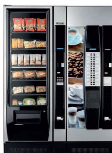
Corallo + Cristallo 600