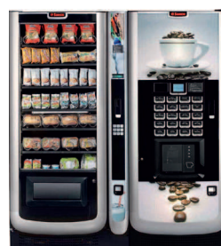
Aliseo + Atlante 700