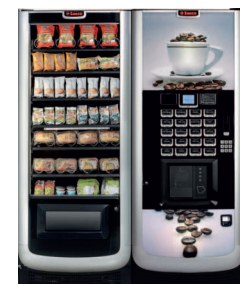
Aliseo Slave + Atlante 700 Master